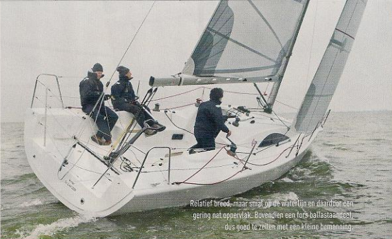
Relatief breed, maar smijt op de waterlijn en daardoor een gering nat oppervlak. Bovendien een lofs ballastankje, dus goed te zeilen met een kleine bemanning

Geven we de boot een klein beetje ruimte, dan loopt hij vlot door naar een kleine 7 knopen. En als we nog wat ruimer sturen wordt het tijd om de gennaker erop te zetten. Die gennaker is optioneel – normaal gesproken vaar je de boot met een spinnaker. De boom laat zich eenvoudig met een lijn bedienen, het zetten van de gennaker mag geen problemen geven. Met dit zeil erbij blijkt dat de A31 ruimwinds lekker wat potentie heeft. In vlagen van zo'n 14 knopen voel je de boot direct versnellen en klokken we een 'dagrecord' van 9,5 knopen. 't Is net te weinig wind om ervoor te zorgen dat de boot écht gaat planeren en ook het relatief ondiepe water ter plaatse