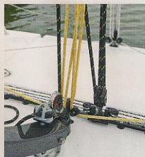
Grootsschoot op een brede overloop, inclusief een fine-tune.