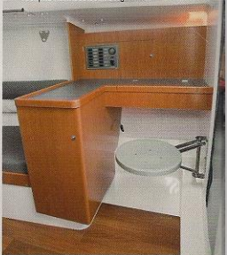
Best hip, eerlijk en in z'n eenvoud keurig afgewerkt. De A31 breekt rigoureus met het typische 'houten' scheepsinterieur, en biedt een volwaardig alternatief.